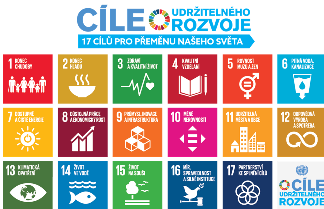
Obrázek 3: Cíle udržitelného rozvoje 12