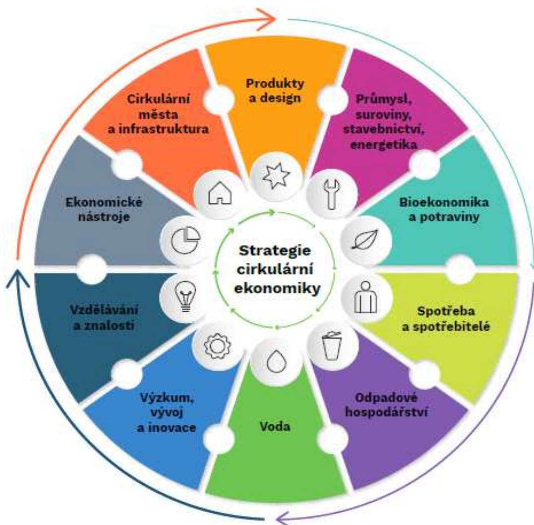
Obrázek 5: Prioritní oblasti, na které se zaměřuje Strategický rámec Cirkulární Česko 2040