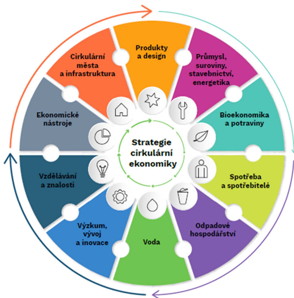
Obrázek 1: Strategie cirkulární ekonomiky