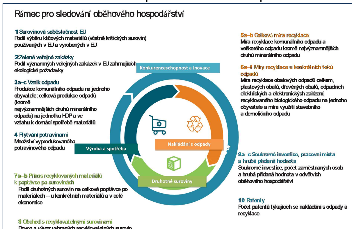
Obrázek 6: Rámec EU pro sledování oběhového hospodářství